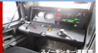
スノーモンキー運転席